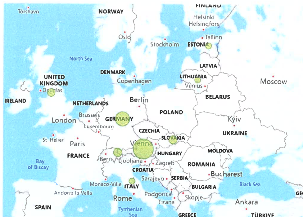
Lav risiko for brudd på arbeidsmiljølovgivning

Enkelte av disse landene er forbundet med moderat sannsynlighet for korrupsjon (markert med gul farge. Grønn farge betyr lav sannsynlighet). Av denne grunn er selskapet spesielt oppmerksom på våre leverandører i Italia, Slovakia og Litauen. Våre kontakter i selskapene under det sveitsisk familieeide konsernet og det amerikanske og børsnoterte konglomeratet som eier disse selskapene har vært hjelpelige med å besvare spørsmål og henvendelser, og vår vurdering er at begge eiere har høy standard for bærekraftig forretningspraksis. Derfor er vår vurdering at det er forbundet med mindre risiko å importere fra disse selskapene enn land-risikoen fra DFØ tilsier.