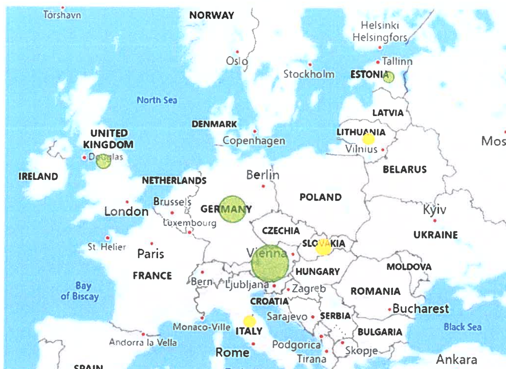
Lav til moderat risiko for korrupsjon

Enkelte av disse landene er forbundet med moderat sannsynlighet for korrupsjon (markert med gul farge. Grønn farge betyr lav sannsynlighet). Av denne grunn er selskapet spesielt oppmerksom på våre leverandører i Italia, Slovakia og Litauen. Våre kontakter i selskapene under det sveitsisk familieeide konsernet og det amerikanske og børsnoterte konglomeratet som eier disse selskapene har vært hjelpelige med å besvare spørsmål og henvendelser, og vår vurdering er at begge eiere har høy standard for bærekraftig forretningspraksis. Derfor er vår vurdering at det er forbundet med mindre risiko å importere fra disse selskapene enn land-risikoen fra DFØ tilsier.